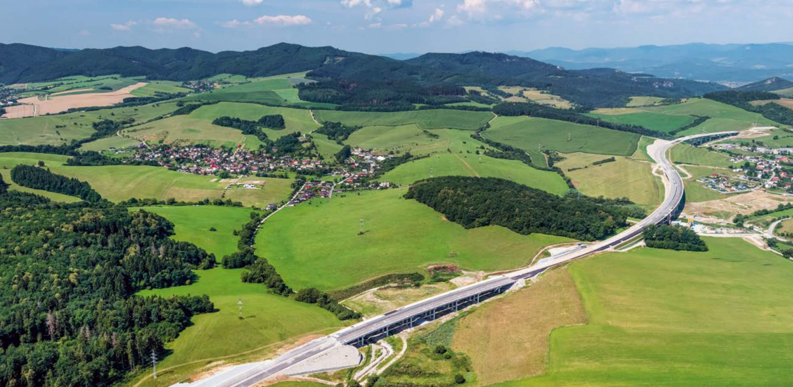
◀ Obec Brezany a najsevernejšie výbežky Súľovských vrchov. V popredí zeleň pretína rozostavaná diaľnica The village Brezany and the most northern tips of Súľovské vrchy. The motorway under construction cuts the greenery in the foreground Matúš Krajňák | Jakub Chovan 2018