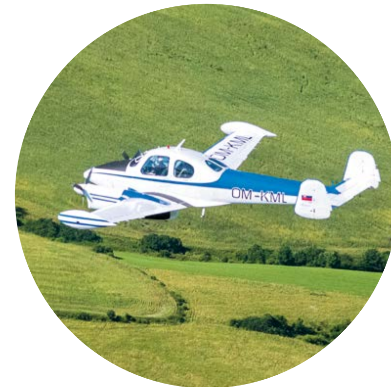
▲ Let L-200 Morava, známy aj ako najkrajšie aerotaxi. Prvý prototyp vzlietol v roku 1957. Päťmiestny dolnoplošník je dodnes obľúbený pri vyhlídkových letoch Let L-200 Morava known as the most beautiful air taxi. The first prototype took off in 1957. The five-seater low-wing monoplane is still popular for sightseeing flights Peter Ciger | Jakub Chovan 2020